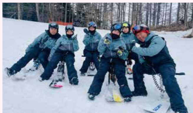
チェアスノーボードスクール併設

※平日の団体営業混雑日は 休校 する事が有ります。詳細はスキースクールホームページをご確認ください。 ※平日・土日祝日混雑が予想される日は一般レッスン内のエキスパート・パラレルレッスンはお受けできない場合がございます。 ※プライベートレッスン・ファミリーレッスンはスクール営業中の希望日1ヶ月前からご予約できます。 ※プライベート・ファミリーレッスンは定数を超えた場合お断りさせていただきます。 ※レッスンは先着順となります当日定員を超えた場合お断りさせていただきます。 ※お越しいただく前に、スキースクールホームページをご覧ください。 ※スキースクールのお支払いは現金のみの取り扱いとなります。