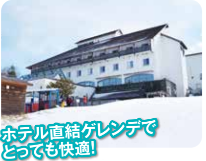
ホテル直結ゲレンデでとっても快適!

営業期間 2024年12月14日(土)~2025年3月23日(日)(予定) リフト運行時間 平日 8:30~16:30 土日祝 8:15~16:45 (早朝営業日は7:15から)