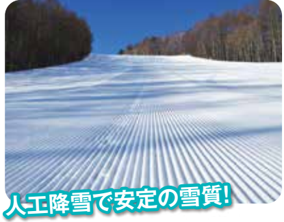
人工降雪で安定の雪質!