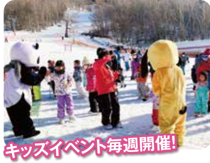
キッズイベント毎週開催!