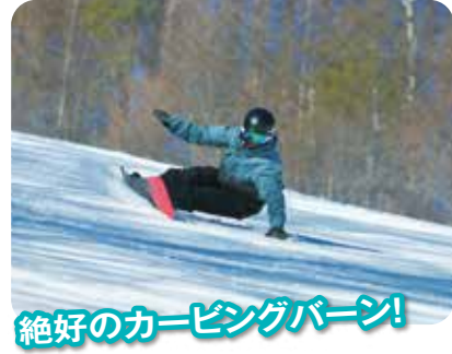
絶好のカービングバーン!