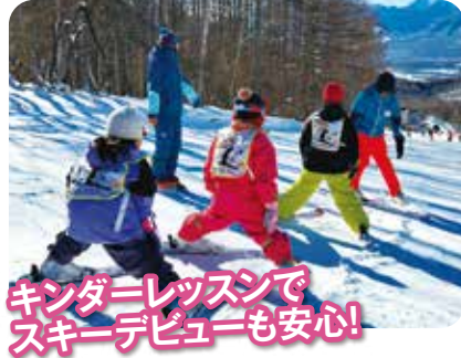
キッズレッスンでスキデビューも安心!

営業期間 2024年12月15日(日)~2025年3月23日(日)(予定) リフト運行時間 平日 8:30~16:30 土日祝 8:15~16:45 (ナイター営業日は19:00まで)