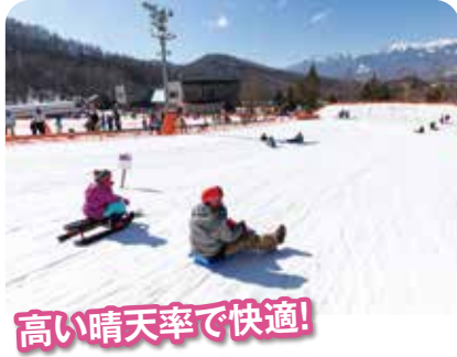
高い晴天率で快適!