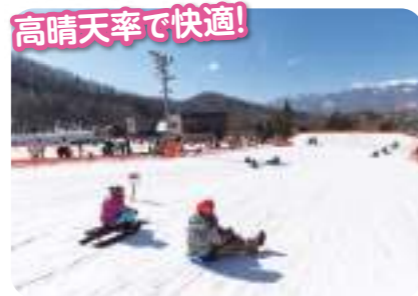
高晴天率で快適! 高い晴天率を誇るハケ岳エリア! ウィンタースポーツはやっぱり晴れていると楽しい!