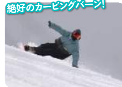
絶好のカービングバーン! 適度な斜度が続くメインコースはカービングが楽しい!