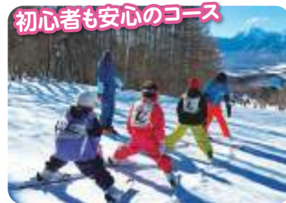
初心者も安心のコース 半分のコースが初級コースで合流型レイアウトなので初心者にも優しいゲレンデ!