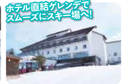
ホテル直結ゲレンデで スムーズにスキー場へ! リゾート内ホテルからはゲレンデ直結なので滞在しながらのウィンタースポーツも快適!