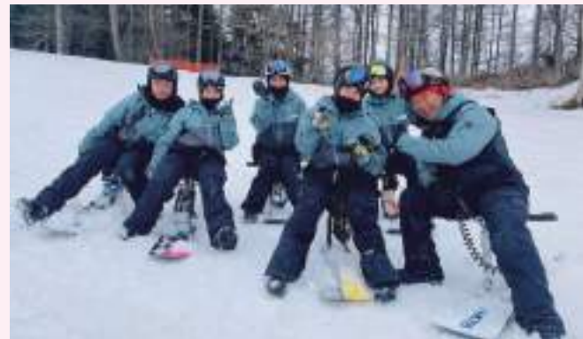
チェアスノーボードスクール併設

※平日の団体混雑日は休校する事があります。詳細はスキースクールホームページをご確認ください。 ※平日・土日祝日混雑が予想される日は一般レッスン内のエキスパート・パラレルレッスンはお受けできない場合がございます。 ※プライベートレッスン・ファミリーレッスンはスクール営業中の希望日1ヶ月前からご予約できます。 ※プライベート・ファミリーレッスンは定数を超えた場合お断りさせていただきます。 ※レッスンは先着順となります。当日定員を超えた場合お断りさせていただきます。 ※お越しいただく前に、スキースクールホームページをご覧ください。 ※スキースクールのお支払いは現金、PayPayのみの取り扱いとなります。