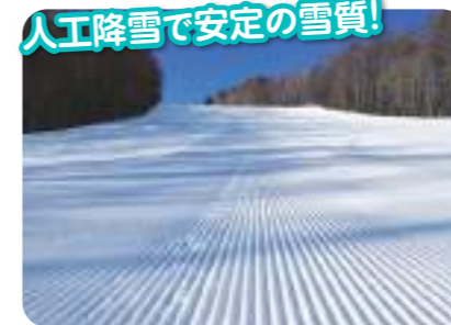
人工降雪で安定の雪質! 人工降雪で安定したコンディションを維持!