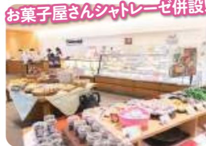
お菓子屋さんシャトレゼ併設! 滑り疲れたら甘いスイーツタイム! 色とりどりのケーキや和菓子が甘いひとときを!